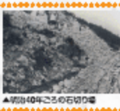
▲明治40年ごろの石切り場