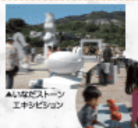
▲いなだストーン エキシビション