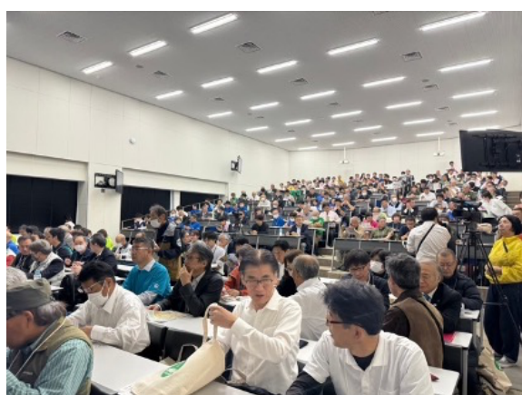
図 48 全国大会 開会式