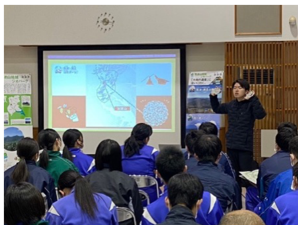
図 7 桜川市立大和中学校出前授業