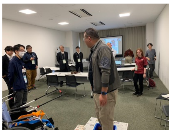
図 51 全国大会 分科会