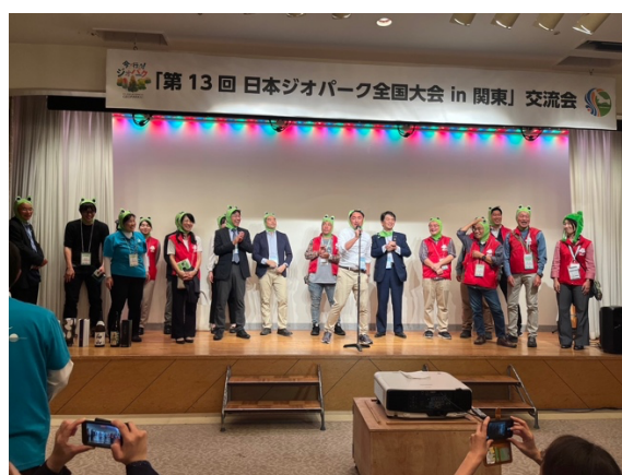
図 49 全国大会 交流会