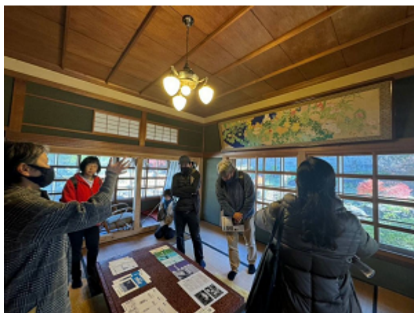
図31 第3回ミニジオツアー