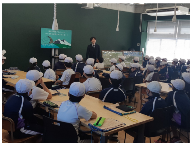
図 12 つくば市立秀峰筑波義務教育学校