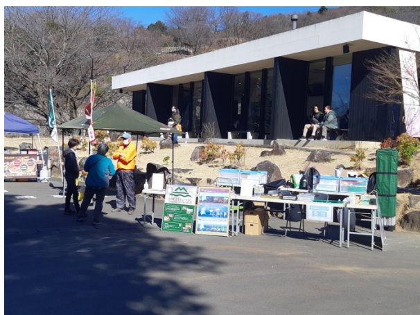
図 43 第 51 回筑波山梅まつり特別イベント 「筑波山地域ジオパークの日」