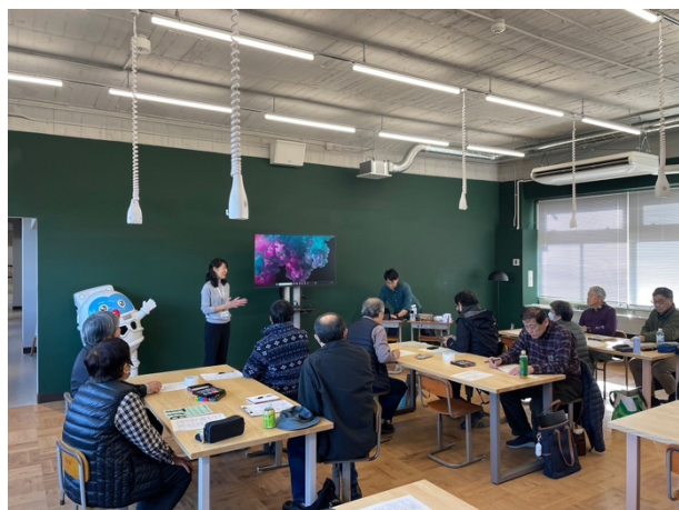
図 25 第2回スキルアップ講座