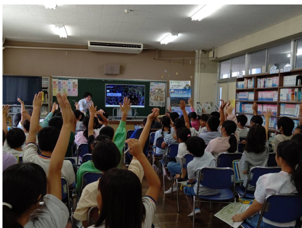
図 6 石岡市立府中小学校出前授業