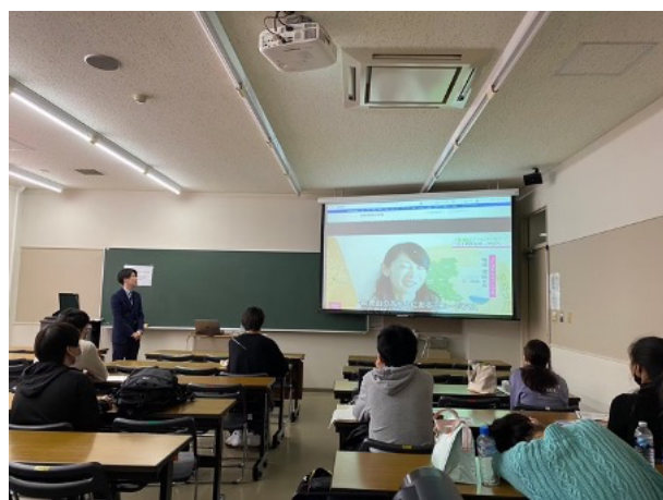
図 9 筑波学院大学出前授業