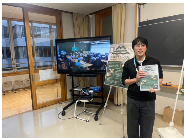
図3 県南理科教育を語る会