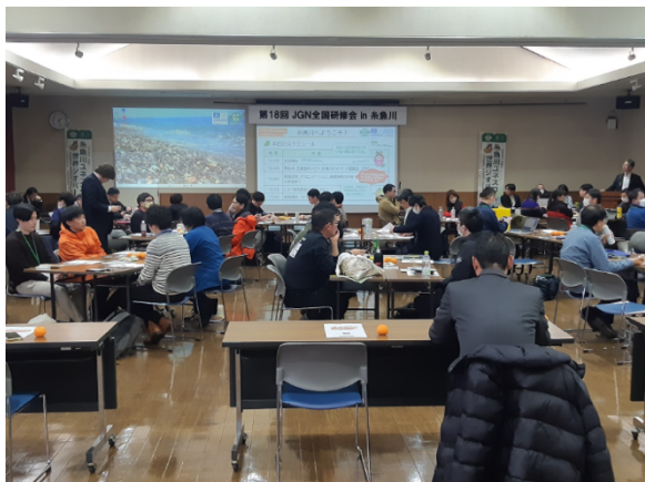
図 52 全国研修会 開会式