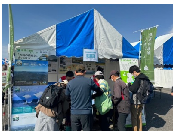
図 50 全国大会 マルシェ