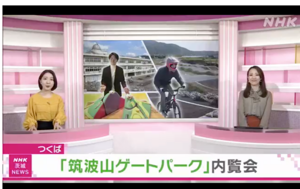
図 45 いば6