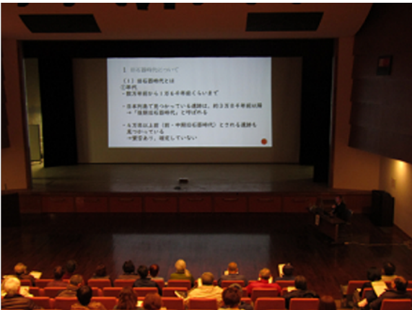
図 20 筑波山地域ジオパーク講演会