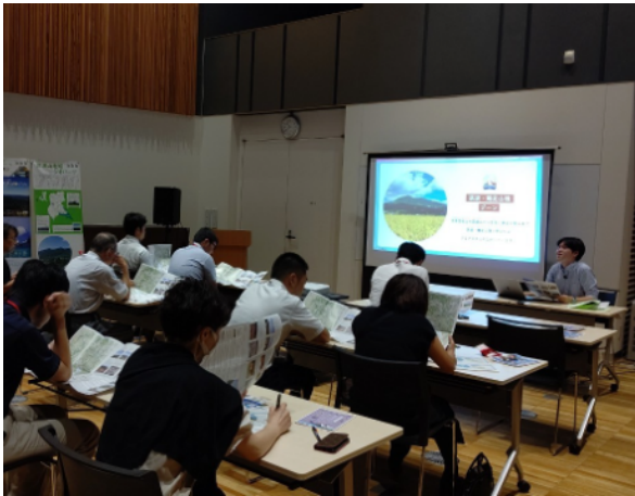
図 14 令和 5 年度教職員のためのジオパーク学習会指導者講座 (石岡会場)