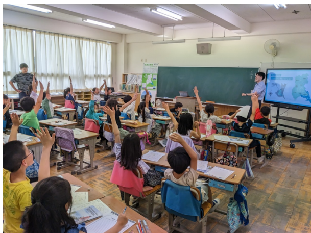
図 4 つくば市立並木小学校出前授業