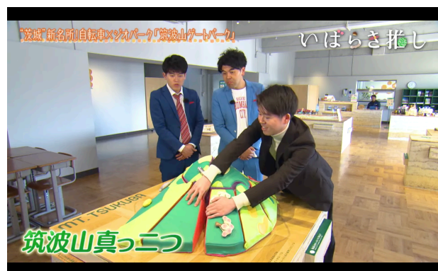
図 46 いばらき推し