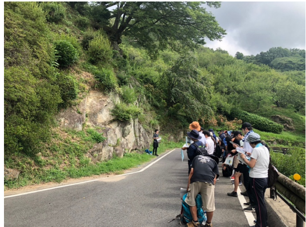
図 15 令和 5 年度県南地区理科実験実技研修会 兼つくば市理科実技研修会