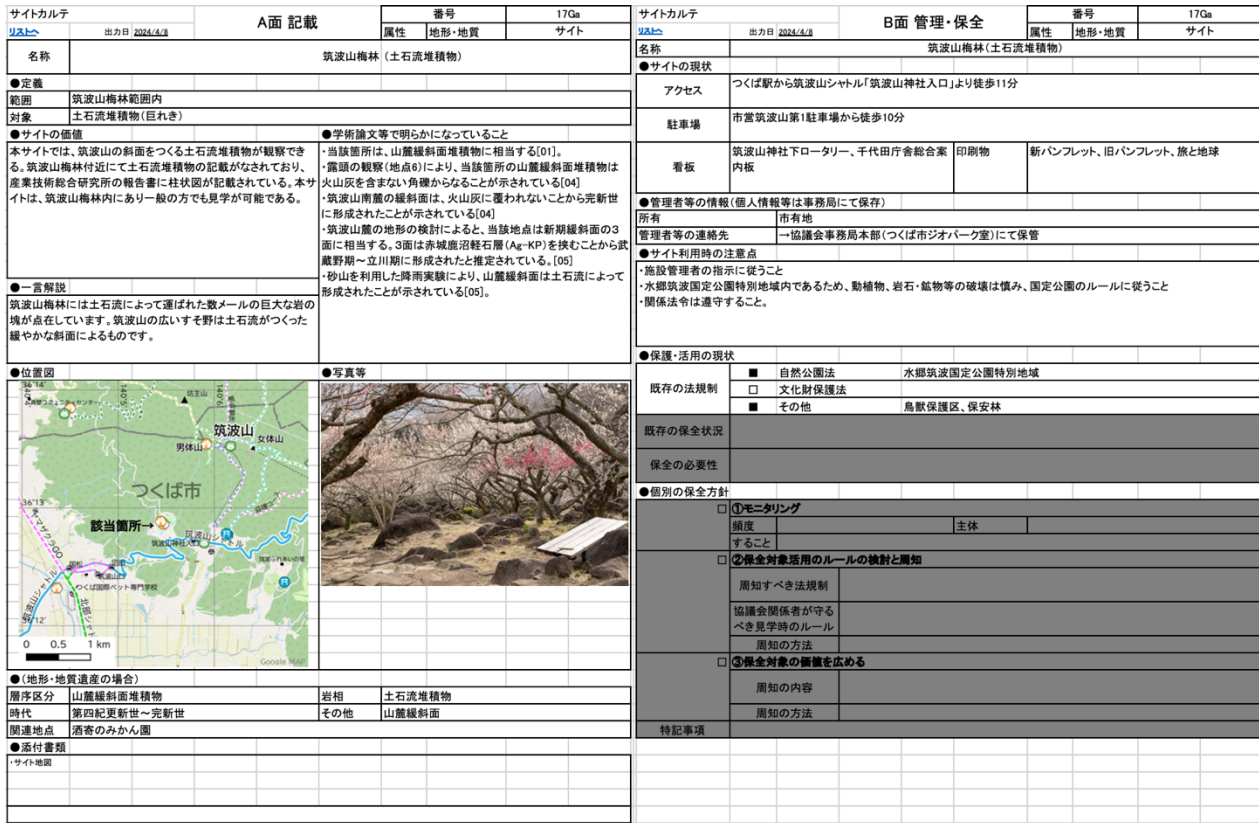
図2 サイトカルテの一例(抜粋)

令和4年度（2022年度）に引き続き作成した「サイト評価シート」をもとに、サイト候補地について「サイトカルテ」を作成した。令和5年度（2023年度）は、管理者・管理団体へのヒアリングの結果を踏まえ、新たにサイトの範囲・対象、サイトの現状、法的保護の現状を記載した（図2）。