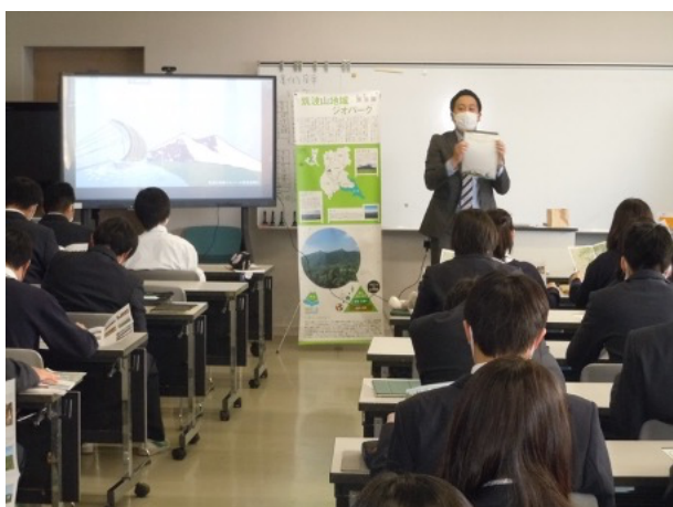
図 8 つくば国際大学東風高等学校 出前授業