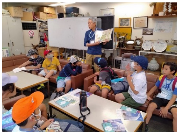
図17 チャレンジクラブ参加者への ジオ講座