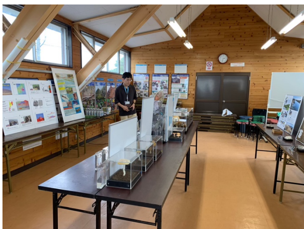
図 40 筑波山臨時ビジターセンター展示