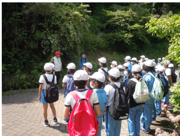
図11 かすみがうら市立下稲吉東小学校雪入ハイキング