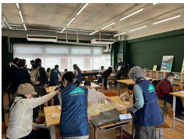
図 42 みんなの登校日 2024 筑波山ゲートパーク体験イベント