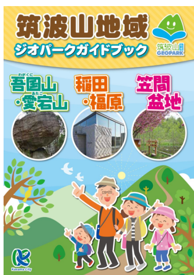
図 36 筑波山地域ジオパークガイドブック (吾国山・愛宕山・稲田・福原・笠間盆地)