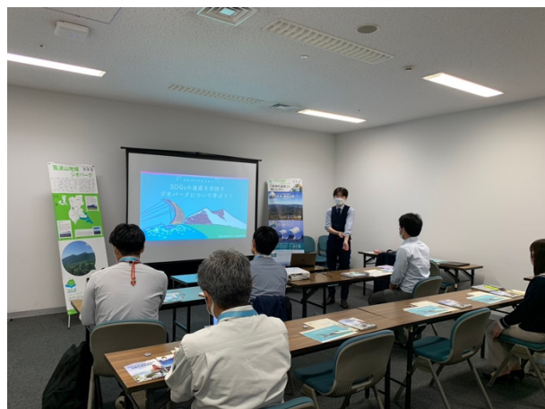
図 33 つくば市職員向けジオパークセミナー