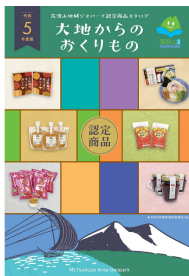
図 37 令和5年度認定商品カタログ 「大地からのおくりもの」