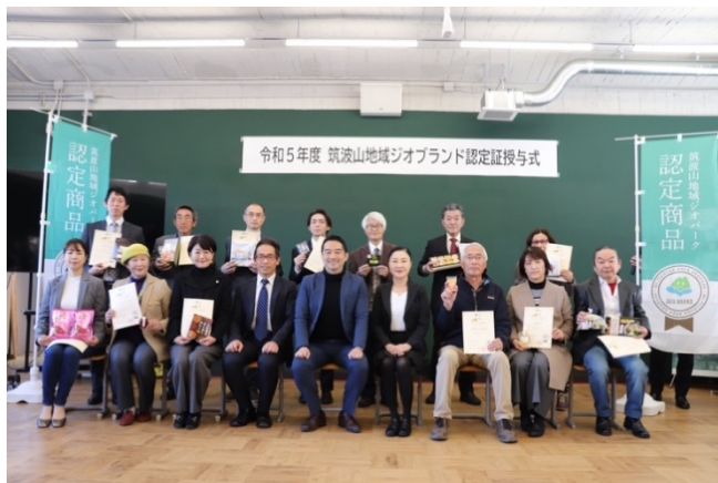
図 27 令和5年度筑波山地域ジオブランド認定証授与式