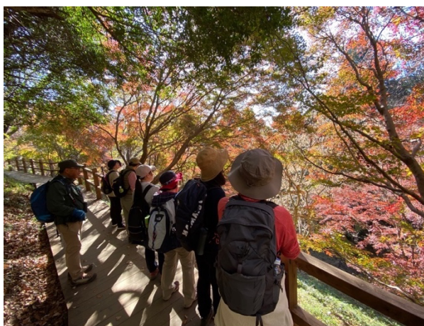
図 23 朝日峠登山～豊かな自然と紅葉を楽しむジオツアー～