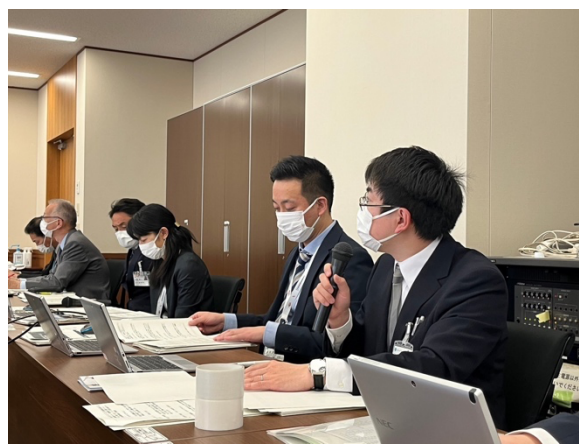
図 29 協議会総会