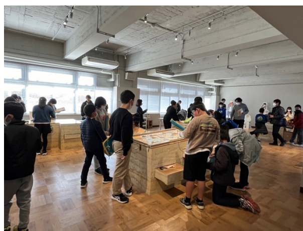
図 13 石岡市立高浜・三村・関川小学校