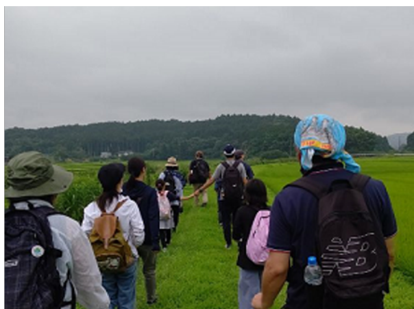
図16 親子で楽しむジオツアー 古代から自然をつないだ八郷盆地を探検！