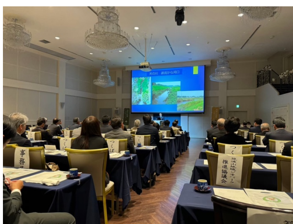
図 32 筑波山地域ジオパーク6市議会議員連盟協議会研修会