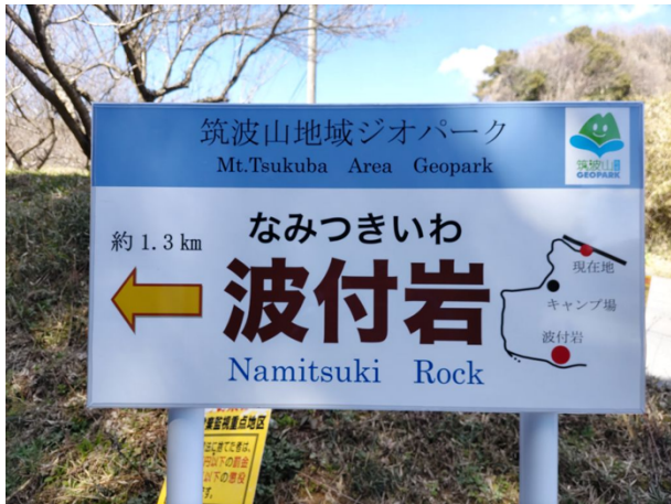
図 44 波付岩の誘導案内板