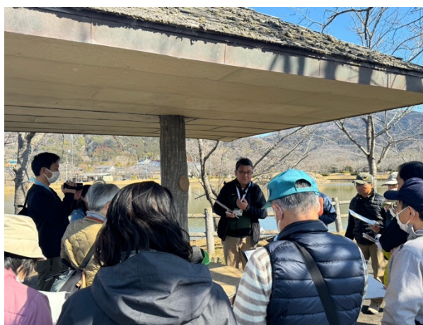
図 26 第3回スキルアップ講座