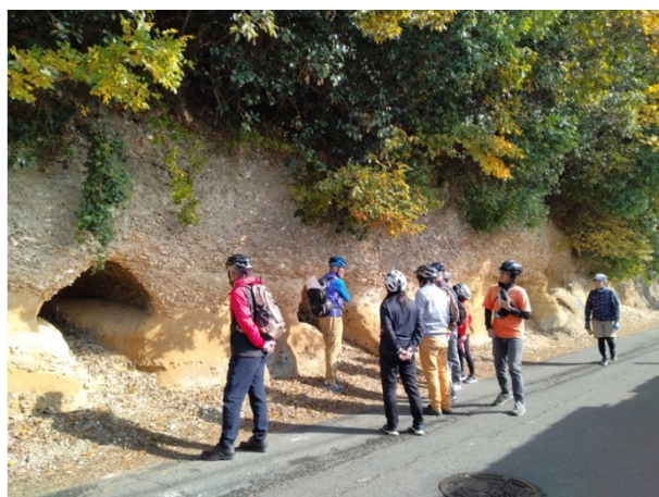
図 22 船と自転車で霞ヶ浦を楽しもう！