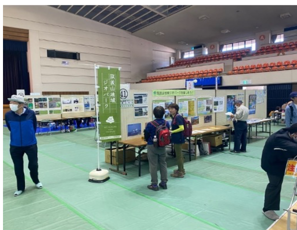
図 41 第 18 回土浦市環境展