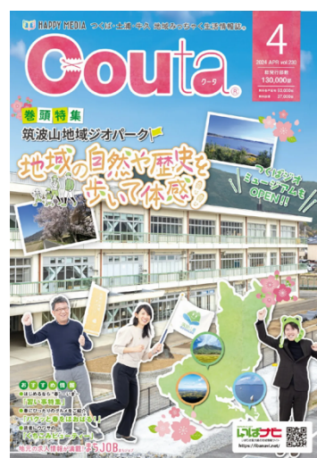
図 35 クータ