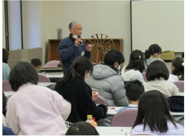
図 19 石岡市ジオパーク 冬休みワークショップ