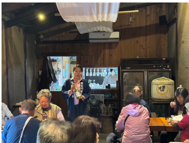
図 21 筑波山地域ポストジオツアー