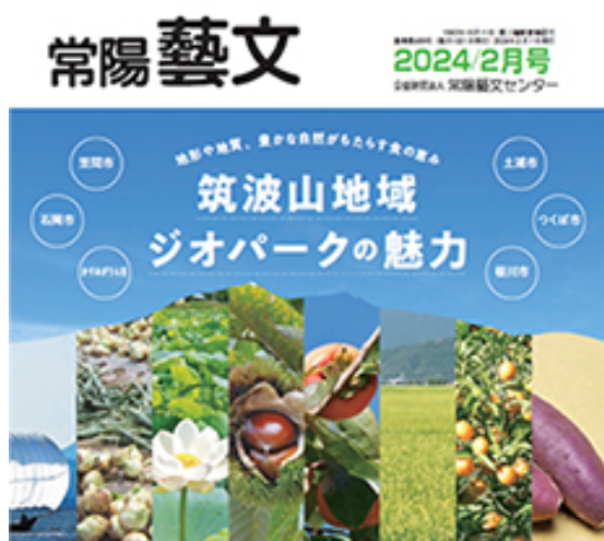
図 34 常陽藝文