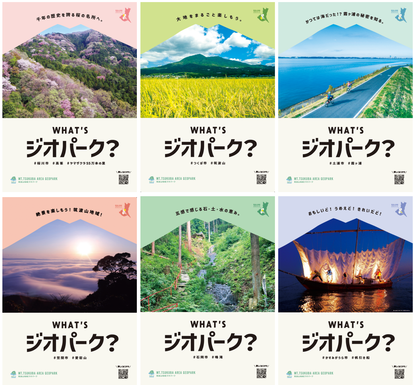
図 39 ジオパーク普及啓発 PR ポスター