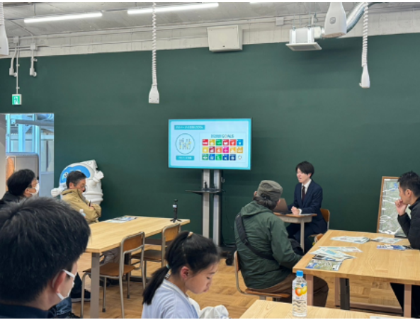
図 18 つくば SDGs パートナー講座