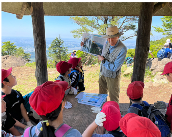
図10 石岡市立恋瀬小学校筑波山登山