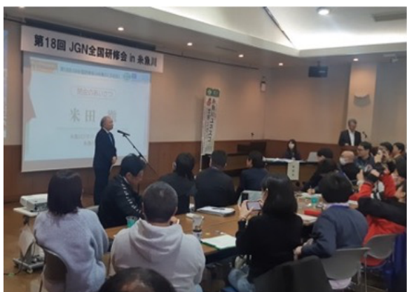
図 54 全国研修会 閉会式