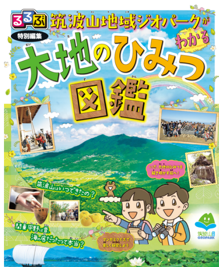
図 38 るるぶ特別編集「筑波山地域ジオパークがわかる 大地のひみつ図鑑」