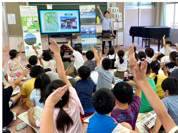
図 5 笠間市立笠間小学校出前授業