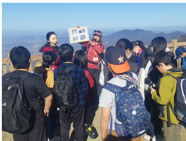
図 24 筑波山地域ジオパークの魅力体験ツアー