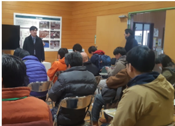
図 53 全国研修会 施設見学