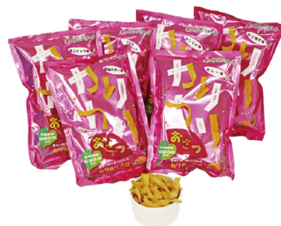
図 28 新規筑波山地域ジオパーク認定商品