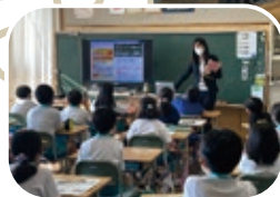
←るるぶ編集塾 (イメージ)