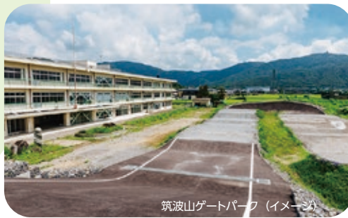
筑波山ゲートパーク (イメージ)