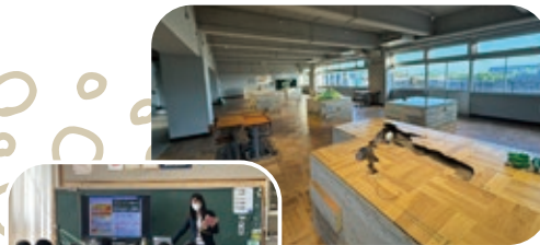
↑つくばジオミュージアム (イメージ)