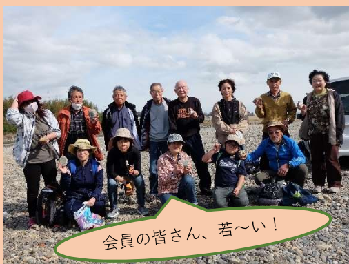
会員の皆さん、若～い！

3人の認定ジオガイドの方が中心になって、初めての来訪者にも笠間市のジオを楽しんでいただけるように、工夫されたフリップや小道具を準備されています。