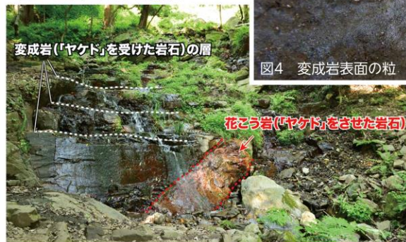
▲図7 変成岩と花こう岩が見られる白滝