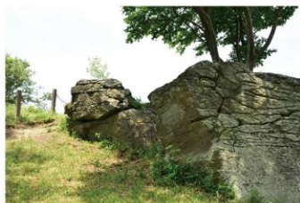
▲図3 宝篋山山頂の変成岩