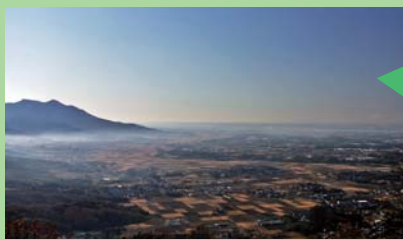
▲日本最大の関東平野

「山と湖をつなぐ平野ゾーン」では、日本最大の関東平野の成り立ちを学ぶことができます。長い年月をかけて蛇行河川が作り出す地形・地質のほか、里山の生態系や水害の歴史など、河川の恵みや猛威とともに暮らす人々の知恵が見られます。