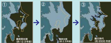
▲海水準変動と海岸線の変遷