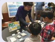
▼ジオキッズセミナーの様子