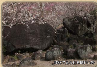
梅林で見られる斑れい岩