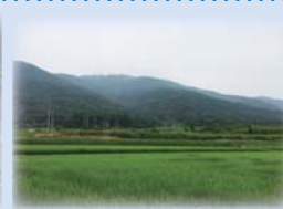
宝篋山南麓の三村山極楽寺跡