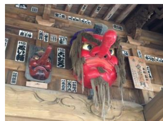
▲ 愛宕山神社 笠間市泉101 TEL:0299-45-5637