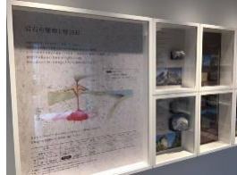
◀ 石の百年館 笠間市稲田2307番地 TEL:0296-74-5114

以上、2回にわたる週末旅情報はいかがでしたか？現在協議会では、こうしたジオパーク内の複数のジオサイトを巡る複数のツアー案を検討中です。今後また違ったジオサイトを旅する情報をご紹介しますと思います！