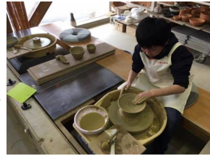
▲ 笠間工芸の丘 笠間市笠間2388-1 TEL:0296-70-1313

花こう岩がもたらす土と水の恵みを満喫した後は、JR稲田駅前の『石の百年館』で、この地域の花こう岩の特徴や成り立ちと、石材産業の歴史を学んで帰りましょう。洗練されたデザインと、豊富な種類の鉱物標本の数々に、きっと目を奪われるはず。一般向けの岩石・鉱物関係の書籍も揃っているので、もっと知りたい人はそれらのチェックも忘れずに。