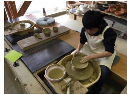
▲ 笠間工芸の丘 笠間市笠間2388-1 TEL:0296-70-1313

花こう岩がもたらす土と水の恵みを満喫した後は、JR稲田駅前の『石の百年館』で、この地域の花こう岩の特徴や成り立ちと、石材産業の歴史を学んで帰りましょう。洗練されたデザインと、豊富な種類の鉱物標本の数々に、きっと目を奪われるはず。一般向けの岩石・鉱物関係の書籍も揃っているので、もっと知りたい人はそれらのチェックも忘れずに。