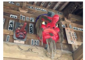
▲ 愛宕山神社 笠間市泉101 TEL:0299-45-5637