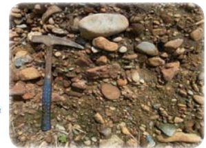
▲禊橋周辺で見られる地層