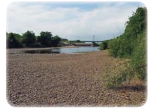
▲禊橋付近での桜川の河原の様子